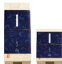
【特選】(ベルナー)1.0号10切入/5切入