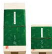
【玉露】(ベルナー)1.0号10切入/5切入