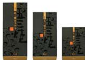
【特選】1.0号10切入/8切入/5切入